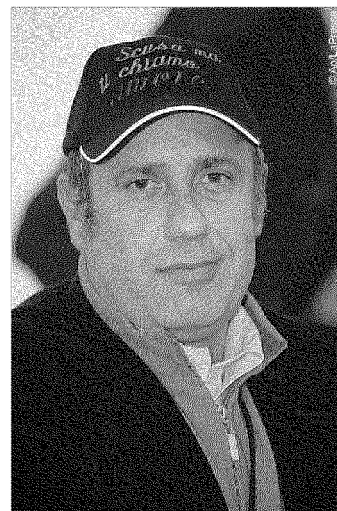
▶ Jonathan Franzen, Andrea camilleri e Federico Moccia