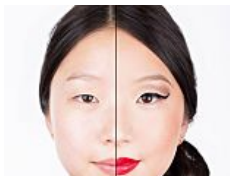
12 FOTO SBALORDITIVE DI DONNE CON...