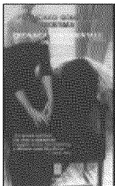
F. González Ledesma CRONACA SENTIMENTALE IN ROSSO Giano, 17 €

INTELLETTUALE americana di inizio secolo la Powell ha celebrato i riti della sua classe con impagabile bravura: il Village, l'arte sempre unita a pochi soldi ma anche a i pigmalioni capaci di cogliere il talento e lanciarlo nel mondo, le tea house dove si scrive e si beve, la metropoli idealizzata che si restringe al piccolo mondo di un pianerottolo o di un caffè. Qui incontriamo una giovane americana piena di entusiasmo e sogni, sola a Parigi. Ma l'indipendenza è una cosa che non si impara sui libri: ci vorranno tempo e lacrime per capire quale è la strada. Molto bello.