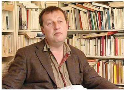
Lo scrittore francese Philippe Forest