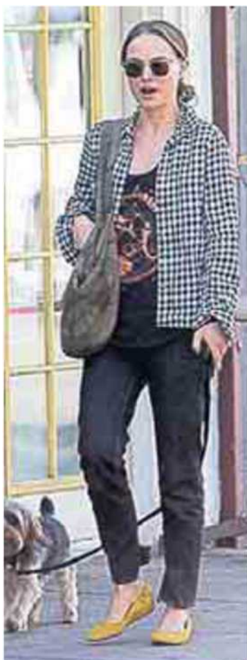
Natalie Portman sceglie il nuovo stile Hipster. In alto a sinistra le gemelle Olses, stiliste del genere

Gli abiti Vestiti e borse disegnati ad hoc da due gemelle stiliste