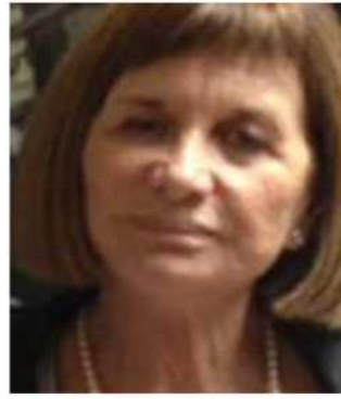
Alicia Gimenez Bartlett