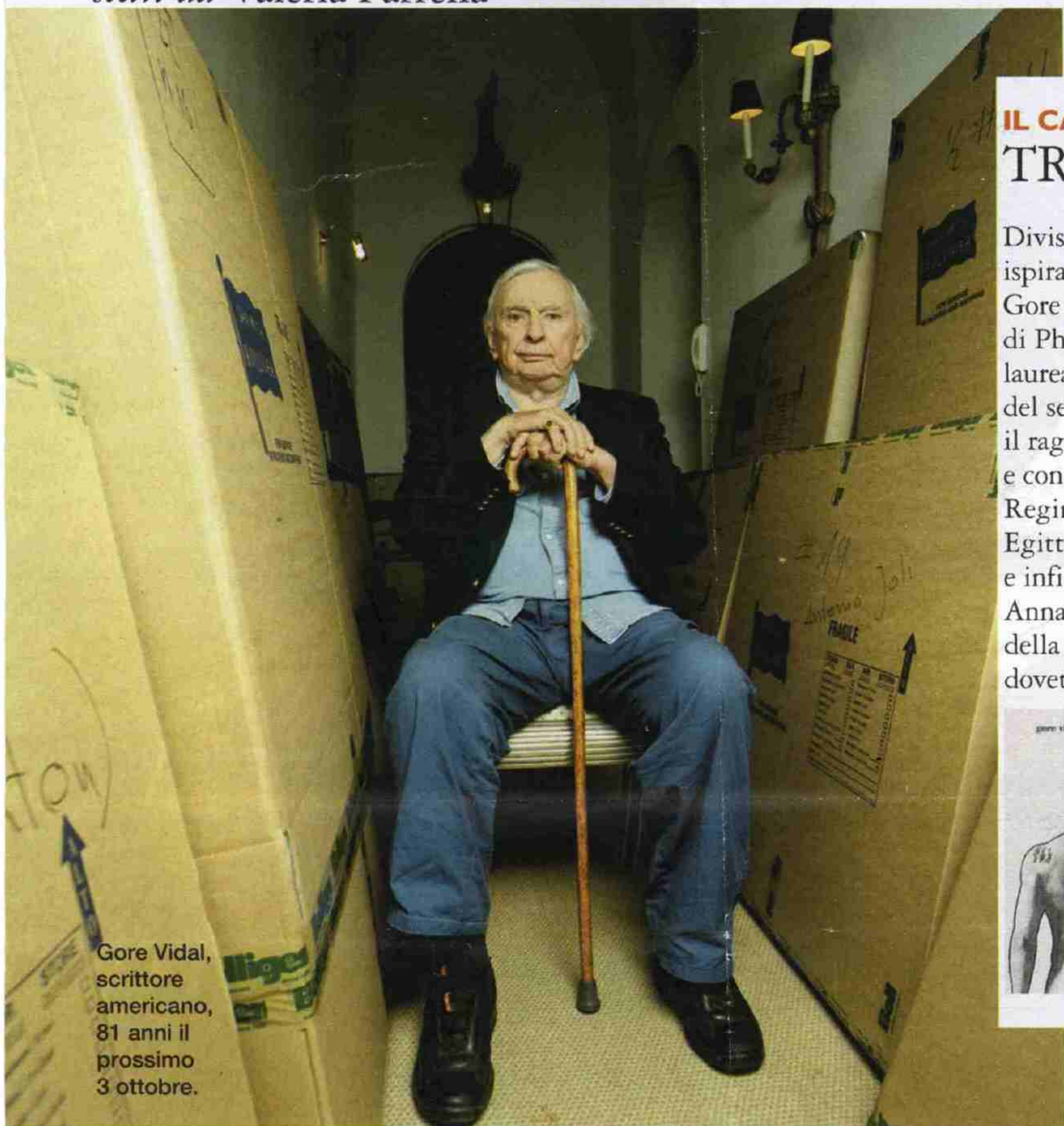
Gore Vidal, scrittore americano, 81 anni il prossimo 3 ottobre.