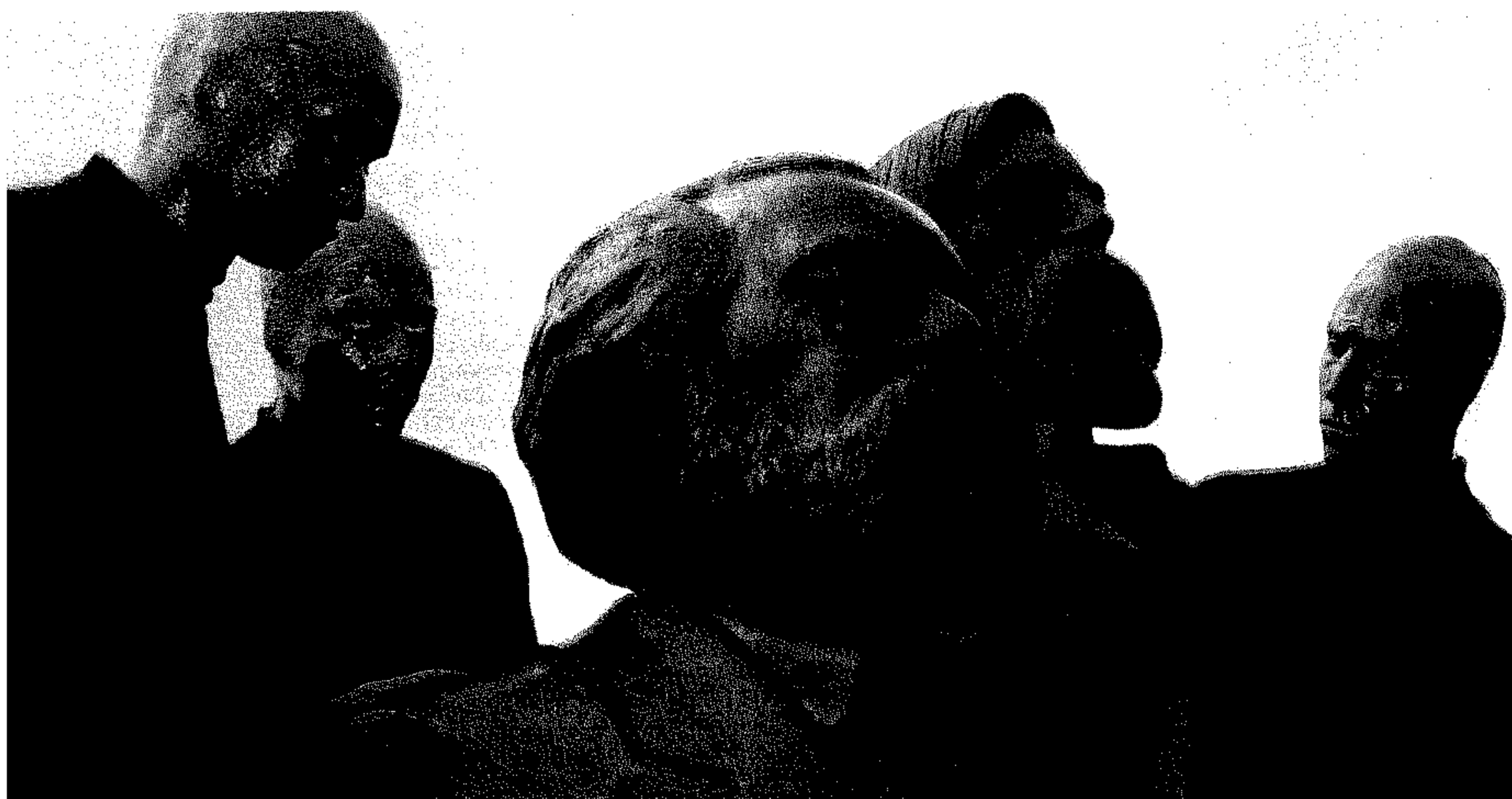
Attali, economista francese, di formazione liberale e «antimarxista» propone una rilettura per il XXI secolo di Karl Marx (qui nella foto, la sua statua, con quella di Engels, a Berlino)

Il suo ultimo libro in italiano è «L'uomo nomade» edito da Spirali, che ha in catalogo anche «Millenium» (1993), «Europa, Europe», 1994, «Trattato del labirinto» (2003). Da Armando è uscito nel 1999 il suo «Dizionario del XXI secolo».