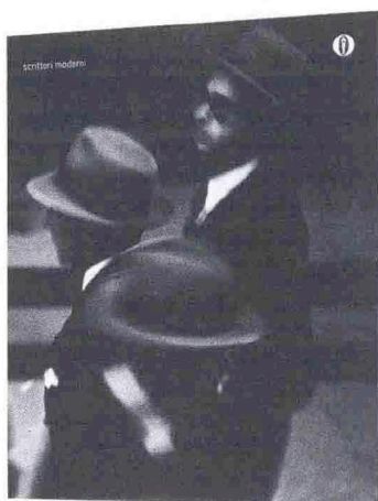
Graham Greene / Il nostro agente all'Avana