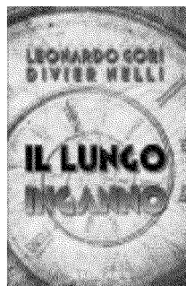
L. Gori- D. Nelli IL LUNGO INGANNO Hobby&Work, 17,50 €

UN RARO 'romanzo perfetto' che non si rifà a modelli ma inventa uno stile che, per brevità, possiamo definire franco-giapponese in quanto mutua dall'appartenenza culturale dei due protagonisti: uno stilista giapponese che vive a Parigi e un archivistista francese chiamata a mettere ordine nella sua collezione di testi e carte sulla meteorologia. La storia della scienza delle nuvole diviene il legame tra il vecchio e la giovane mentre le loro esistenze virano verso esiti che mai avrebbero potuto immaginare prima di conoscersi. Bello bello.