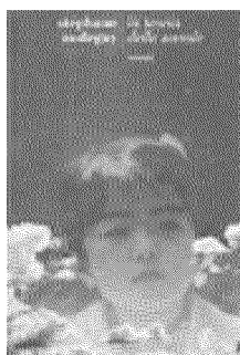
Stéphane Audeguy LA TEORIA DELLE NUVOLE Fazi 18 €

AFFASCINANTE , coinvolgente, divertente: il bambino e poi adolescente André raccoglie i ricordi di quando abitava con la famiglia ad Alessandria d'Egitto. Una famiglia ebrea formata da almeno una ventina di componenti che parlano tra loro in sei lingue, ciascuno degno di essere il protagonista unico di un romanzo: Vili filofascista e spia inglese al tempo stesso, le due nonne in competizione, la madre sorda, il padre dongiovanni ... Fino all'ultima notte, nel '65, quando furono cacciati dal paese dove vivevano da tre generazioni. Da non perdere.