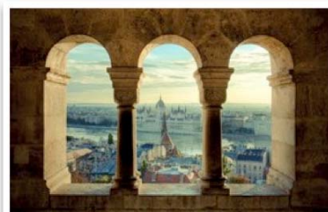
Il mondo secondo Traveller di Vera Zennaro