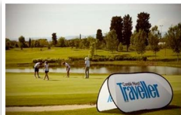
First Golf Challenge Tutto quello che c'è da sapere sul torneo di Condé Nast: date, green, vincitori, premi, curiosità!