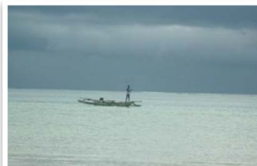
Le foto dei lettori di Traveller 28 MAGGIO. ZANZIBAR di ALDA ELENA