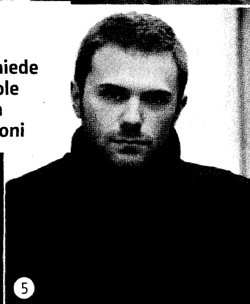
1 New York vista dall'alto. 2 Barack Obama. 3 Il suo «rivale» Mitt Romney. 4 Elizabeth Strout. 5 Paolo Giordano

“ La scrittura richiede tempo se si vuole che ogni parola esprima emozioni