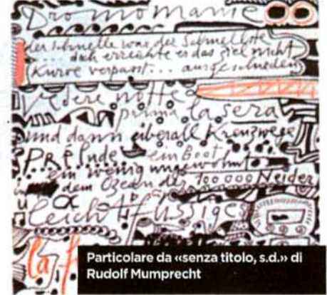
Particolare da «senza titolo, s.d.» di Rudolf Mumprecht