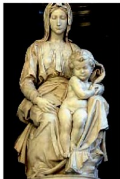
ICM, BOYER INCAMERASTOCK, CCPIRIS