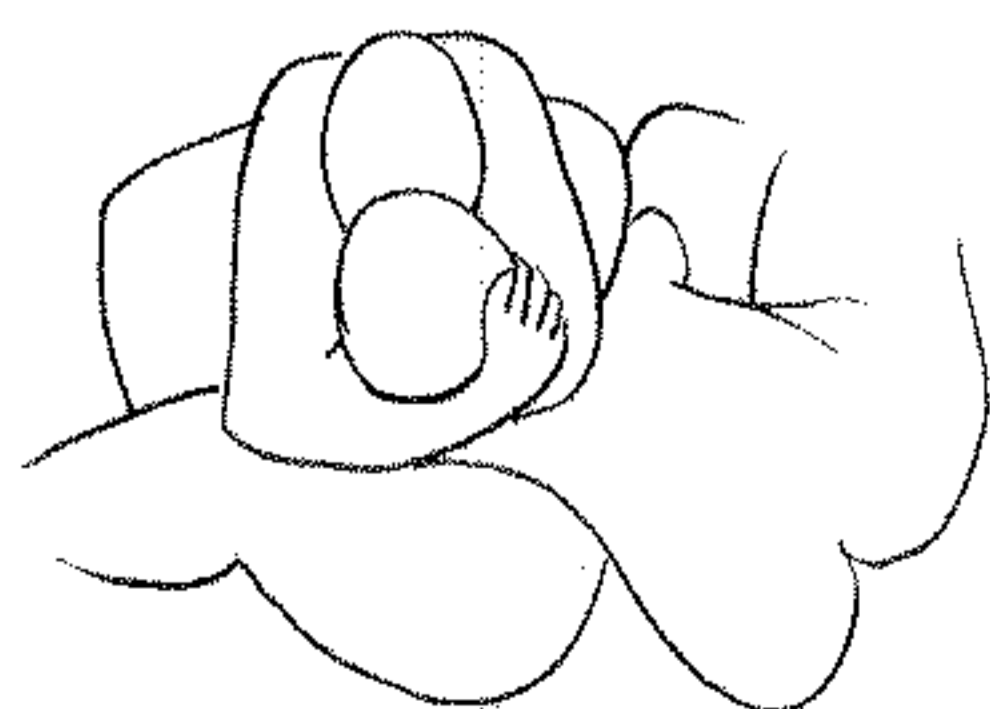
Un disegno di Matisse, «Coppia» (illustrazione da «Le lacrime di Eros» di Bataille, Bollati Boringhieri)