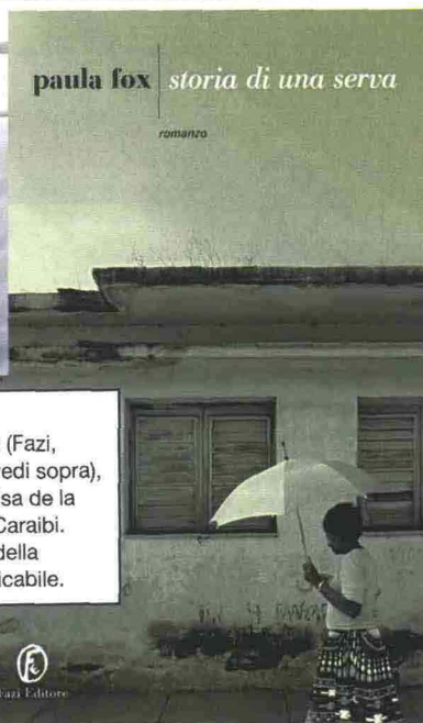
paula fox storia di una serva