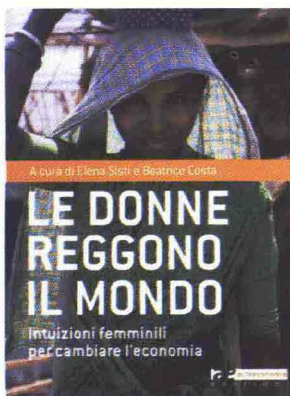
ELENA SISTI E BEATRICE COSTA (A CURA DI) LE DONNE REGGONO IL MONDO Intuizioni femminili per cambiare l'economia Ed Altraeconomia pp. 123, Euro 12,00

Il sottotitolo è 'Intuizioni femminili per cambiare l'economia' e le pagine che seguono non tradiscono le aspettative. Attraverso 12 conversazioni curate da Elena Sisti e Beatrice Costa con esperte di economia, docenti universitarie e giornaliste sono proposte analisi e riflessioni "per guardare all'economia e al lavoro con occhi di donna", occhi capaci di vedere anche il bisogno di cura, la necessità della relazione e l'attenzione per le nuove generazioni. Il diritto, il cibo, il clima, il welfare sono i titoli del nuovo libro che va scritto in una prospettiva di genere per "cucinare" un futuro possibile e sostenibile. Amico delle donne.