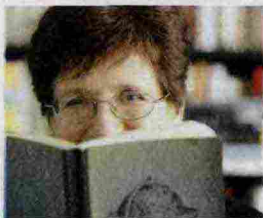
di Nicoletta Sipos