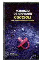
figura di detective che ascolta e parla con la gente, tenendo i sensi ben aperti, seguendo odori, tracce, mezze verità.

Due storie che corrono parallele: una riguarda una neonata abbandonata in pessime condizioni vicino a un cassonetto; l'altra un cagnolino sottratto al proprietario. Nessuna denuncia, al commissariato di Pizzofalcone, ma questi poliziotti – nonostante la pessima fama che li accomuna – il loro mestiere lo sanno fare veramente: verranno a capo di una sordida vicenda in cui sono proprio i più piccoli e innocenti a pagare. In questa nuova serie ideata da Maurizio De Giovanni, viene fuori una