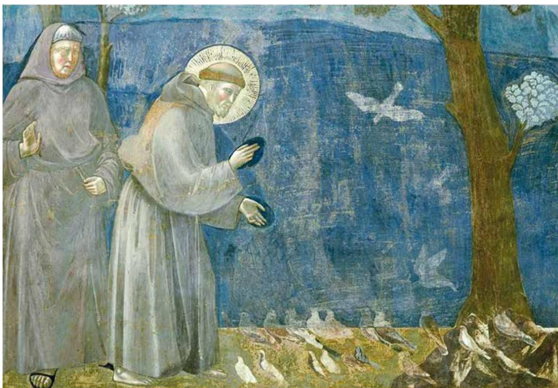
«La Predica agli uccelli», dal ciclo di affreschi delle Storie di san Francesco della Basilica superiore di Assisi, attribuiti a Giotto

Insomma, mentre in Europa si dibatteva sull'eredità di Francesco e sulla sua interpretazione all'interno dell'Ordine, si produceva una memoria, anch'essa oggetto di polemica, della sua presenza nel Vicino oriente e del suo significato per il francescanesimo e la cristianità tutta: è la complessità della vicenda e degli infiniti sviluppi ai quali ha dato vita a spiegare perché scriverne oggi è ancora rilevante.