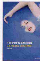
La vera Justine, Stephen Amidon, Mondadori, 19,50 euro

cinematografica. Dal 1990 a oggi ha pubblicato altri sei romanzi, fra cui Il capitale umano , che nel 2014 è diventato un film di grande successo, diretto dal regista italiano Paolo Virzì. Attualmente vive in Massachusetts.