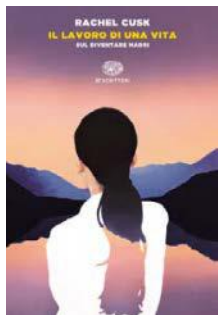
Il lavoro di una vita Rachel Cusk, Einaudi, 12 euro

✓ «Le dissi come fosse tutto difficile, le raccontai l'esilio dal passato e il senso di esclusione..., le dissi che mi sembrava di essere rinchiusa in una scatola, di non riuscire a respira-».