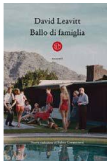
Ballo di famiglia David Leavitt, SEM, 17 euro

✓ Con Ballo di famiglia , una raccolta di racconti brevi, Leavitt si colloca nella scia dei grandi autori nordamericani del Novecento, per molti dei quali il racconto è un banco di prova letterario ineludibile, se non un genere esclusivo. Pensando ad Alice Munro, canadese, premio Nobel della letteratura nel 2013, ma anche a Hemingway, Salinger, Joyce Carol Oates e molti altri. Leavitt mostra in queste pagine tutto il suo talento nel ritrarre la middle class americana che semplicemente vivendo sotto i nostri occhi di lettori rivela se stessa per quello che è: una società fragile e sofferente, imperniata sulla famiglia, che non si salva dai suoi naufragi. Che non supera i divorzi, le delusioni. Che ha sempre le stesse esitazioni, vergogne, paure. Generazione dopo generazione si cimenta a vincersi, ma ancora perde.