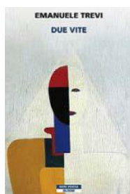
Due vite Emanuele Trevi, Bloom Neri Pozza, 16 euro

Scrivere bene Turati e il suo ritratto del padre single è divertente e verosimile. Si ride anche quando si dovrebbe piangere, data la malattia di detto padre. Peccato lo sbandieramento politico a ogni pagina anche quando la trama lo rende ridondante.