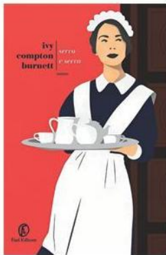
IVY COMPTON-BURNETT SERVO E SERVA (traduzione di Manuela Francescon, Fazi, pp. 300, euro 19)

In Italia Laura Lepetit, recentemente scomparsa, la inserì, con l'occhio attento che la contraddistingueva, nel catalogo della sua Tartaruga. Ora Fazi prosegue la ripubblicazione delle opere di Compton Burnett con questo brillante romanzo, basato, al pari degli altri, su un fuoco di dialoghi, inframezzati da sferzanti descrizioni fisiche, come se i personaggi recitassero su un palcoscenico teatrale.