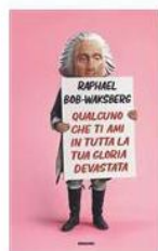
R. BOB-WAKSBERG QUALCUNO CHE TI AMI IN TUTTA LA TUA GLORIA DEVASTATA (Einaudi) Racconti d'amore, di disagio, assurdi o romantici dal creatore della serie animata BoJack Horseman.