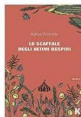
AGLAJA VETERANYI LO SCAFFALE DEGLI ULTIMI RESPIRI (Keller) Il libro postumo di una scrittrice di lingua tedesca, nata in una famiglia di circensi rumeni. Onirico.