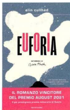
IL ROMANZO VINCITORE DEL PREMIO AUGUST 2021 Il più prestigioso premio letterario di Svezia