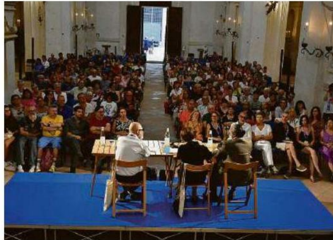
Shehan Karunatilaka

Il protagonista del romanzo è proprio un fotografo, perché nel suo paese di origine mancano le testimonianze visive. Ci sono racconti e scritti, ma l'immagine sembra quasi essere scomparsa. Forse anche le testimonianze visive non porteranno ad un equilibrio e ad una pace duratura, ma vedere le atrocità che sono state commesse, forse renderà più difficile convincere le masse che le guerre siano giuste.