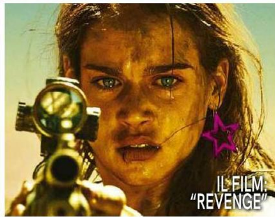
IL FILM: "REVENGE"

IL LIBRO Sopra, la cover di "Tutto brucia". A ds., il film "Revenge" (2017) con Matilda Lutz, 32 anni, che interpreta una donna che si vendica dopo aver subito abusi. Più sopra, una scena della serie Netflix "La casa di carta" diretta da Koldo Serra, stesso regista di "Regina rossa", ora su Prime, tratta dall'omonimo libro di Gómez-Jurado. In alto, ecco proprio i due protagonisti di "Regina rossa", Vicky Luengo, 33, nei panni di Antonia Scott, e Hovik Keuchkerian, 51.