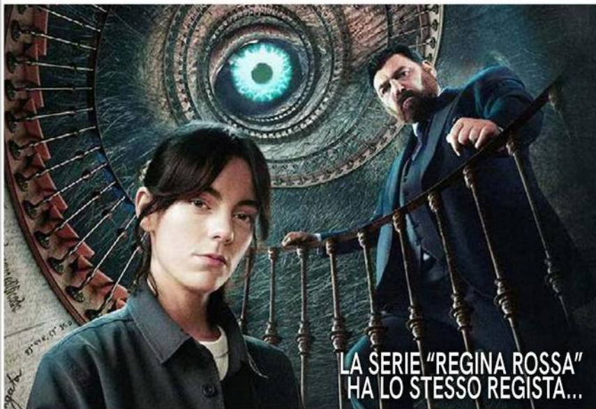
LA SERIE "REGINA ROSSA" HA LO STESSO REGISTA...