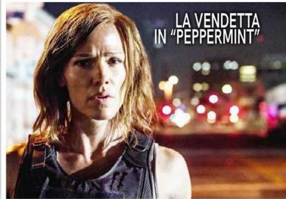
LA VENDETTA IN "PEPPERMINT"