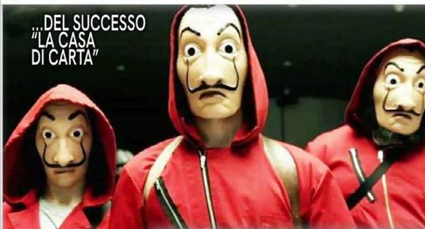
...DEL SUCCESSO "LA CASA DI CARTA"