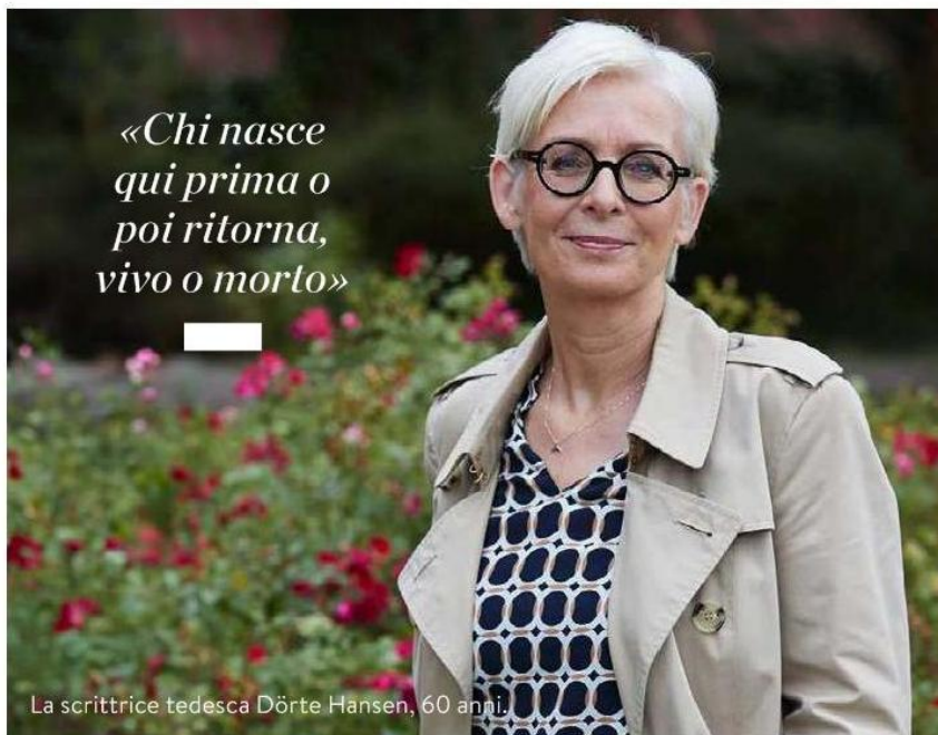
La scrittrice tedesca Dörte Hansen, 60 anni.

unico mezzo di sostentamento, ma ha anche portato cambiamenti e fatto perdere autenticità al luogo. Se da un lato i nativi si prestano ad alimentare le leggende e impersonare i cliché - la moglie custode del focolare, il fascino lupo di mare, il prete pastore di anime -, dall'altro lottano per mantenere un legame vero con il mare e con la loro storia. E quando un giorno una balena si arena sulla spiaggia, sembra il presagio di una tempesta che stravolgerà in poco tempo la vita dei Sander.